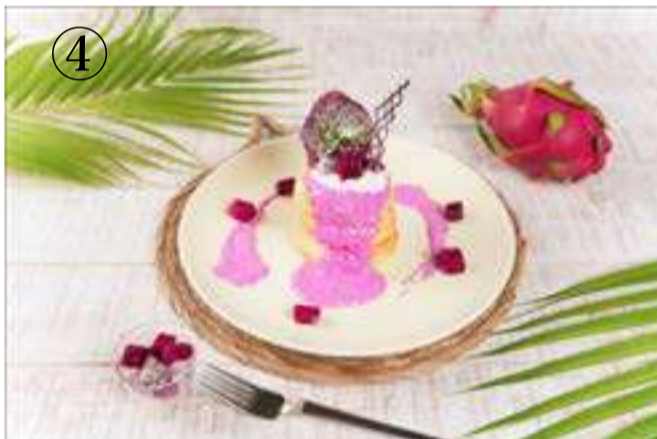
④ ドラゴンフルーツのパンケーキ

島の果実パインアップル、ドラゴンフルーツ、 とろけるチーズ、パンズ、トマトスライス、リーフレタス等