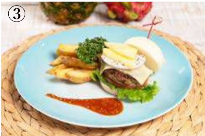
③ うちなー・トロピカルバーガー