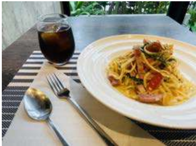
① スーチカーと春菊のペペロンチーノ リングイネ トリュフ風味

TRUFFLE-FLAVORED LINGUINE PEPPERONCINO WITH SŪCHIKĀ PORK AND CHRYSANTHEMUM GREENS