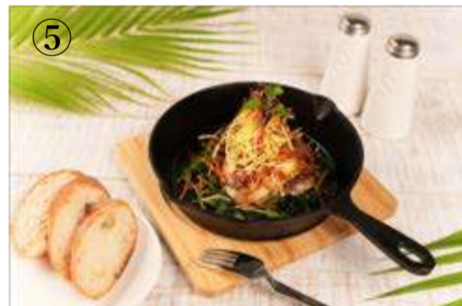
⑤ やんばるハーブ鶏のあんだんすー(油味噌)焼き

GRILLED YANBARU HERB CHICKEN WITH OKINAWAN OIL MISO