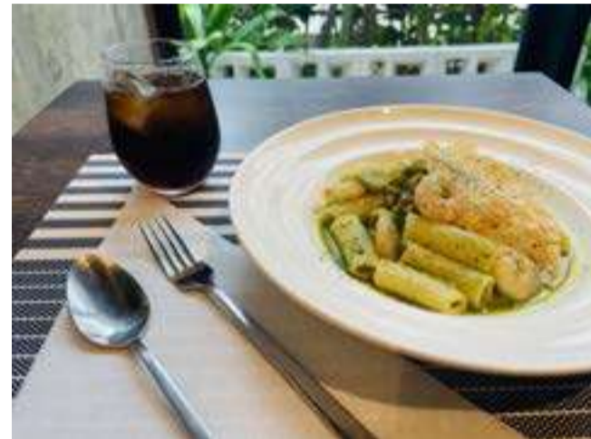
② 小エビとムキアサリのジェノベーゼ・リガトーニ

TRIGATONI GENOVESE WITH SHRIMP AND SHELLED CLAMS