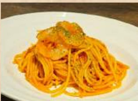
Garlic Tomato Seafood Pasta