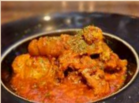
Spicy Tomato Stew