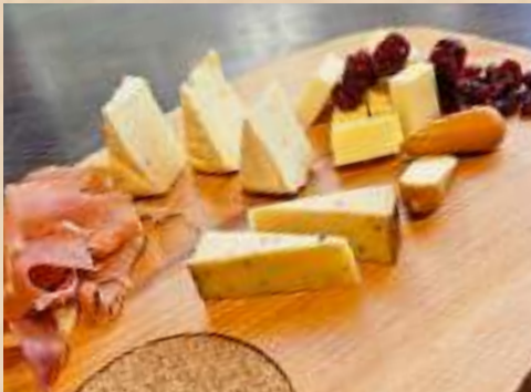
Hamon Serrano & Cheese Platter