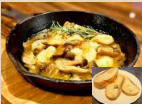
Garlic shrimp and mushroom in olive oil