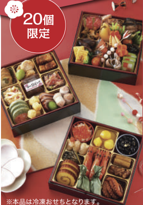
※本品は冷凍おせちとなります。