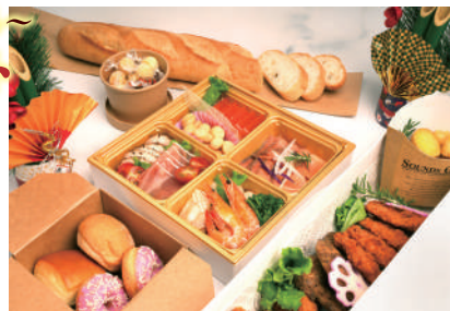
※季節・天候により内容が変更になる場合がございます。 ※数に限りがございます。2日前までご予約ください。